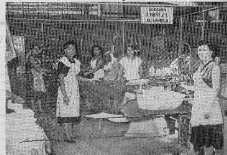
DESMANCHADO AL HUMEDO.—La extracción de manchas no grasosas requiere un tratamiento individual para cada prenda y está al cuidado de un experto personal equipado para tratar con certeza y de manera eficaz, cualquier tipo de mancha. Aquí se analizan las manchas difíciles técnicamente, auxiliados siempre por las informaciones emanadas del NATIONAL INSTITUTE OF DRY CLEANING, la cual estamos afiliados. Por consejo de esta Institución, aclaramos que "NUNCA SERA POSIBLE REMOVER TODA CLASE DE MANCHAS DE TODA CLASE DE TELAS".

LA BANDA QUE GARANTIZA Y DISTINGUE. Escribe en sus camisas este sello de distinción y elegancia y tenga la seguridad de obtener un servicio 100% eficiente.— Sólo nuestra BANDA DE GARANTIA se lo asegura.