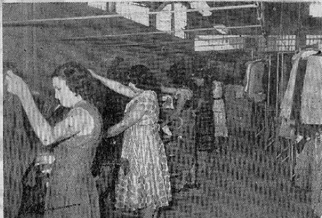
APLANCHADO GENERAL.—Miles de vestidos son aplanchados semanalmente en esta sección y revisados individualmente para corregir cualquier defecto y mantener a la clientela un servicio superior en la limpieza y acabado de sus ropas.