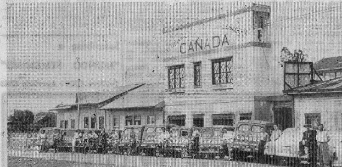
Plantas del Canada Dry Cleaning & Lavandería. El más eficiente y puntual servicio a domicilio se brinda a la clientela mediante estas rápidas unidades encargadas de la recolección y entrega de las ropas. Un seleccionado e idóneo Cuerpo de Mensajeros recorre diariamente todos los sectores de la capital y distritos circunvecinos. El color ROJO de nuestras unidades se distingue en los cuatro puntos cardinales de esta ciudad y como un símbolo de distinción frente a las residencias de lo más selecto de nuestra sociedad.