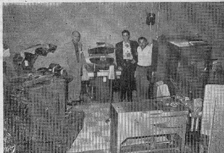
MARAVILLOSAS MAQUINAS ELECTRONICAS PARA EL APLANCHADO DE CAMISAS.—Exclusiva Unidad de Gabinete, única en América Latina, la cual en el escaso tiempo de tres meses de estar al servicio de la estimada clientela del Canada Dry Cleaning, ha conquistado con la nitidez de su trabajo la voluntad de un público que con su exigencia y buen gusto en el vestir, ha dado a esta empresa el primer puesto en esta clase de servicios. INCREIBLE PERO CIERTO. Actualmente se lavan semanalmente no menos de mil camisas, y la demanda aumenta considerablemente semana a semana. Cualquier cantidad de camisas maravillosamente limpias y aplanchadas... en sólo veinticuatro horas. Lleve sus camisas a cualquiera de estas oficinas: Las Plantas en Barrio México; Agencia No 1 al pie de Cuesta de Niños; Agencia No 2 Avenida San Martín, 50 varas oeste del Acorazado España. NO HAY RAZON AHORA PARA QUE USTED SUFRA ATRASOS EN EL ARREGLO DE SUS CAMISAS. Obtenga un servicio ultra rápido sin recargo en las tarifas.

Sea inteligente! Prefiera siempre la limpieza técnica y el aplanchado perfecto de sus ropas. Ambos son necesarios para su distinción.