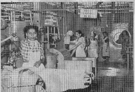
LAVADO EN SECO.—Siempre tratando de mejorar los sistemas, se ha puesto al servicio del público sin cargo adicional, el eficiente sistema americano de lavado en seco "CARGADO" (charged system). Su eficacia supera en un 25% a los sistemas usuales, disminuyendo notablemente la necesidad del desmanchado y con ello la fricción que deteriora las ropas.

Sea inteligente! Prefiera siempre la limpieza técnica y el aplanchado perfecto de sus ropas. Ambos son necesarios para su distinción.